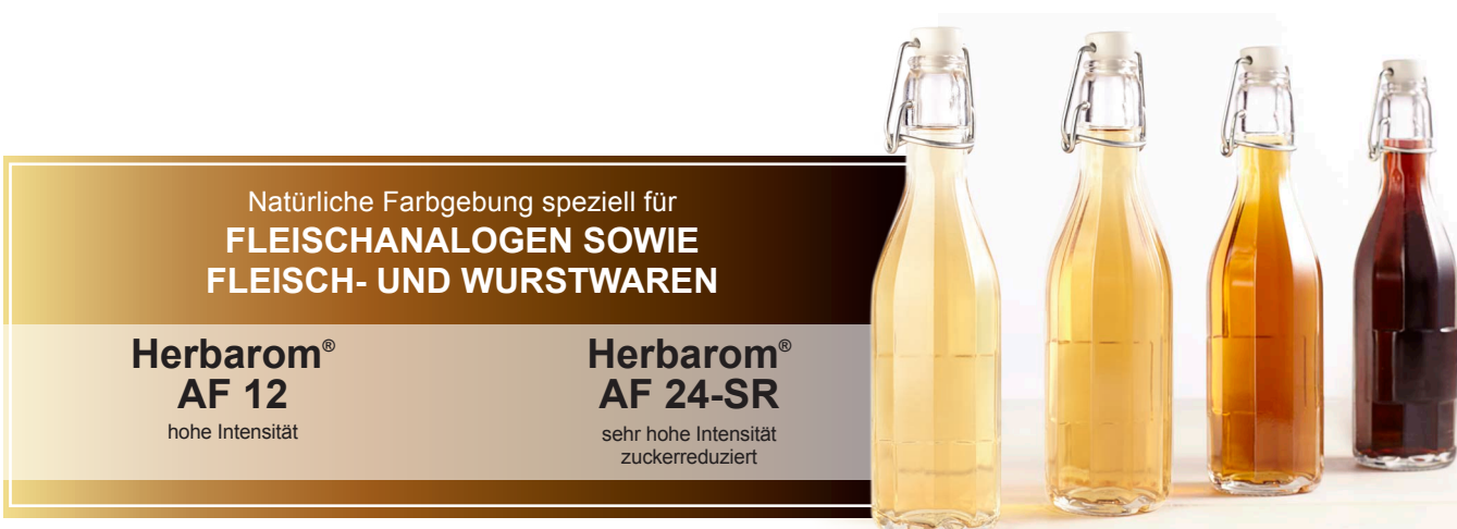
Farbspektrum von Herbarom® Goldgelb bis Dunkelbraun